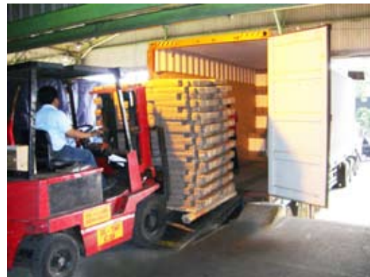
【コンテナの積込作業】

工場で使用する電力は全て自社で発電しており、余った電力は、工場周辺の住民の方々に無料で供給しております。