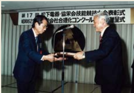
昭和 62 年、共栄会合理化コンクール表彰式

1965 年、資材部からのオーダーが始まりましたが当時からコストダウンは本当に厳しいものでした。