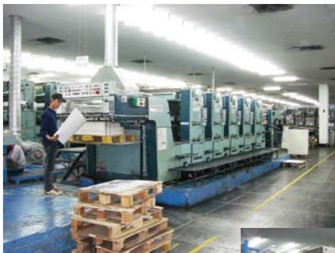
【オフセット印刷機】