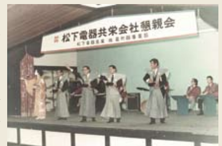
松下電器共栄会 懇親会は盛大だった！