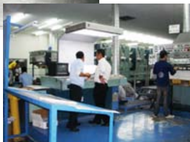
※印刷の品質をチェックしている様子