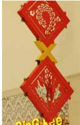
天井から吊るされています

一枚の段ボールから籠が立ち上がり、シルエットを成すのは、さすがマゴクラフト様といったところですよ。